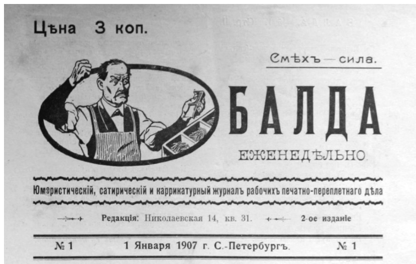
Рис. 1. Журнал «Балда», №1, 1907 г. Стр. 1

В титульном комплексе также присутствует рисунок, изображающий работника типографии за работой (Рис. 1). В последующих номерах журнала графический элемент будет меняться, сохраняя свою смысловую нагрузку. Это будут изображения различных полиграфических процессов (Рис. 2, 3). Графический элемент очень гармонично вписался в титульный комплекс, он сочетается с другими элементами и несет как эстетическую, так и смысловую нагрузку.