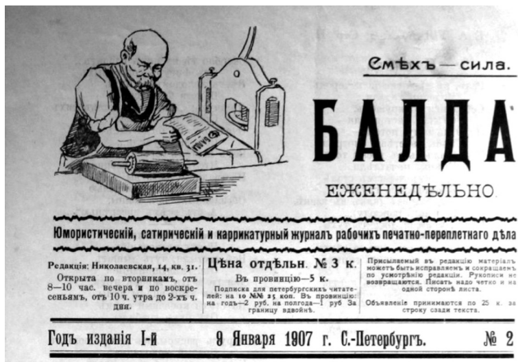
Рис. 2. Журнал «Балда», №2, 1907 г. Стр. 1