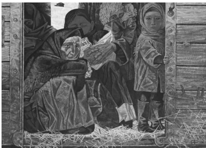
Рис. 2. Яхиханов Р. В неизвестность. 2014 г. Холст, темпера. 150x208,5

проработки образов: старика-чеченца в папахе, скорбно смотрящего из зарешеченной двери вагона; обреченно сидящей прямо на полу пожилой женщины в повязанной по мусульманской традиции платке, и чеченской девочки, с наивным любопытством смотрящей на все происходящее. Обрамление портретов составляют дощатые стены вагона и солома, которая служит постелью всем этим людям. Непременное изображение папахи (на голове старика и выглядывающего из глубины вагона юноши) обозначает этническую принадлежность героев картины, говорит об их приверженности традиционным ценностям, нежелании изменить им даже в самые трагические моменты жизни [8].