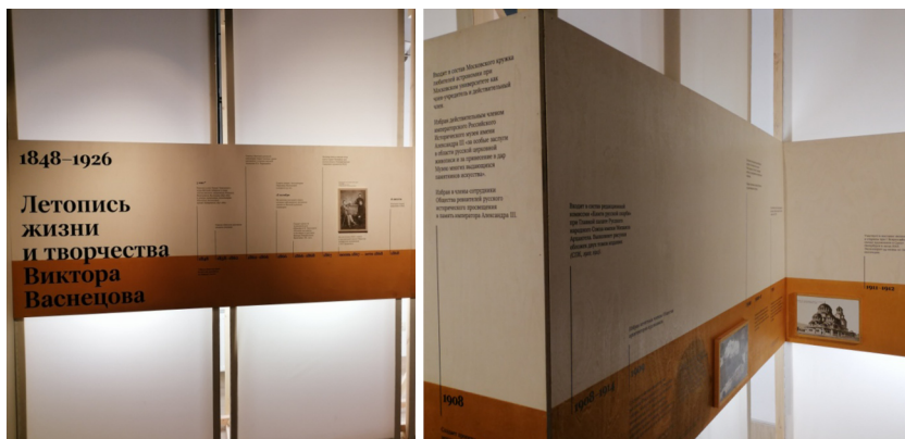
Рис. 1. Начало экспозиции. Летопись жизни и творчества В.М. Васнецова. Фотография автора

представляет собой закрепленные чуть ниже уровня глаз (вероятно, для того, чтобы с текстом могли ознакомиться не только взрослые посетители, но и дети) фанерные листы с напечатанным текстом, включающим основные даты и события жизни художника. Некоторое удивление вызывают добавленные в подписях к редким фотографиям стрелки, так как сами изобразительные материалы немногочисленны, и спутаться в них едва ли представляется возможным. Стоит отметить и некоторую неравномерность распределения материала – в иных «временных отрезках» фотографии документов и снимки буквально «жмутся друг к другу», а местами мы можем лицезреть лишь пустые белые отрезки незаполненного ничем пространства. Разумеется, это упущения не столько дизайнеров, работавших над созданием экспозиции, сколько научных работников, занимавшихся подготовкой материала и не представивших дополнительных визуальных источников.