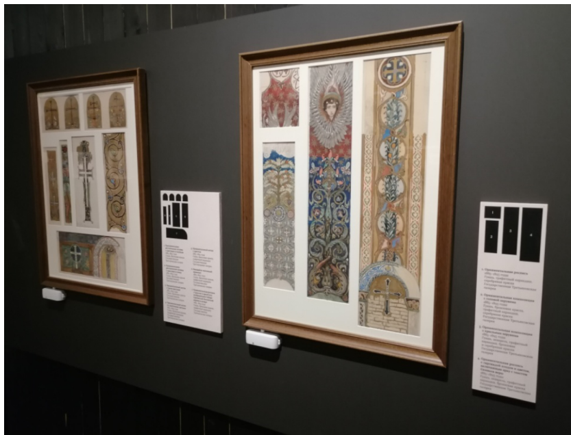
Рис. 6. Васнецов В.М. Эскизы орнаментов. Fig. 6. Vasnetsov, V.M. Sketches of Ornaments.

всем туловищем: это, а также болезненно-истерическое выражение некоторых лиц, сообщает всему изображению тот слишком реалистический характер, который ослабляет впечатление» [18, с. 204].