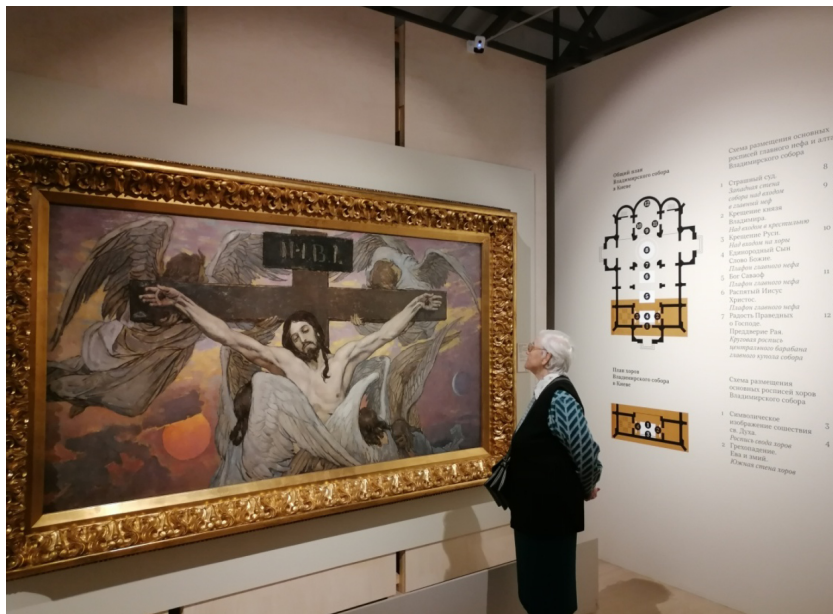
Рис. 3. Васнецов В.М. Распятый Иисус Христос. 1890. Картон для росписи плафона главного нефа Владимирского собора в Киеве. Fig. 3. Vasnetsov, V. M. The Crucified Jesus Christ. 1890. Carton for the ceiling painting of the main nave of St. Vladimir's Cathedral in Kyiv.

чрезмерно реалистичное изображение неземных существ вызывает у современного зрителя скорее недоумение, нежели чувство благоговейного трепета. Например, на полотне «Едиnorodный Сын Слово Божие» позади фигуры Иисуса Христа в образе Эммануила изображение Тетраморфа – крылатого существа с четырьмя ликами: человека, льва, быка и орла (символы четырех евангелистов Матфея, Марка, Луки и Иоанна) – удивляет: если левая сторона с ангелом и орлом, выступающими из-за облаков, не вызывает вопросов, то, при реалистичном изображении голов тельца и льва, у последних отсутствуют туловища или же объекты, закрывающие их от взора зрителя. Анатомически верные и реалистично изображенные головы животных покоятся на легких проплывающих облаках, при этом крылья, похожие на лебединые, с детально прописанным оперением вырастают в шеи изображенных животных.