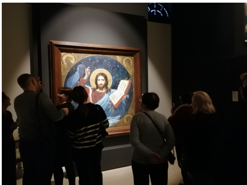
Рис. 7. Васнецов В.М. Христос Вседержитель. 1886. Картон для росписи плафона главного купола Владимирского собора в Киеве. Fig. 7. Vasnetsov, V. M. Christ Pantocrator. 1886. Carton for the ceiling painting of the main dome of St. Vladimir's Cathedral in Kyiv.

которые изображены графически в виде обрамляющего полотно орнамента с четырех сторон, что представляется нам гораздо более удачным стилистическим выбором художника, нежели на полотне «Единородный Сын Слово Божие». Биограф, искусствовед и писатель В.Л. Кигн писал об изображении Христа Спасителя в куполе Владимирского собора, что «после византийского Христа нет ни одного изображения, которое передавало бы образ Богочеловека в такой полноте и с таким совершенством...» [5, с. 39]