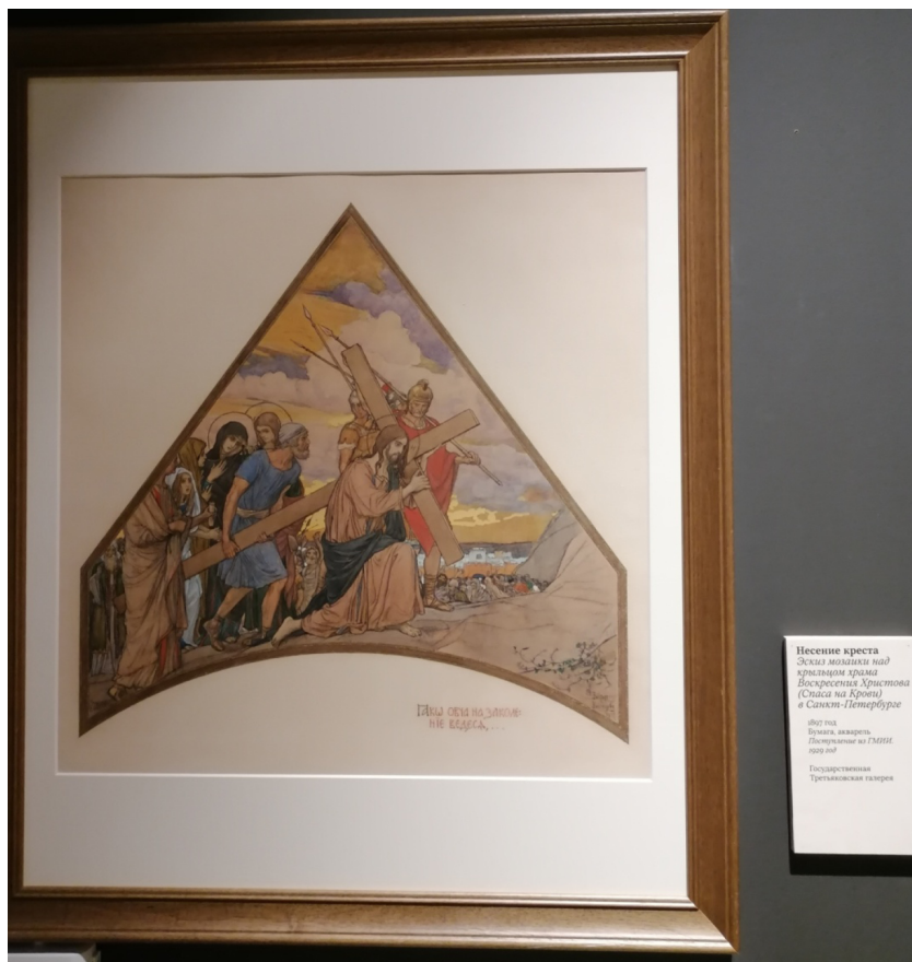
Рис. 10. Васнецов В.М. Несение креста. 1897. Эскиз мозаики над крыльцом храма Вознесения Христова (Спас на крови) в Санкт-Петербурге.