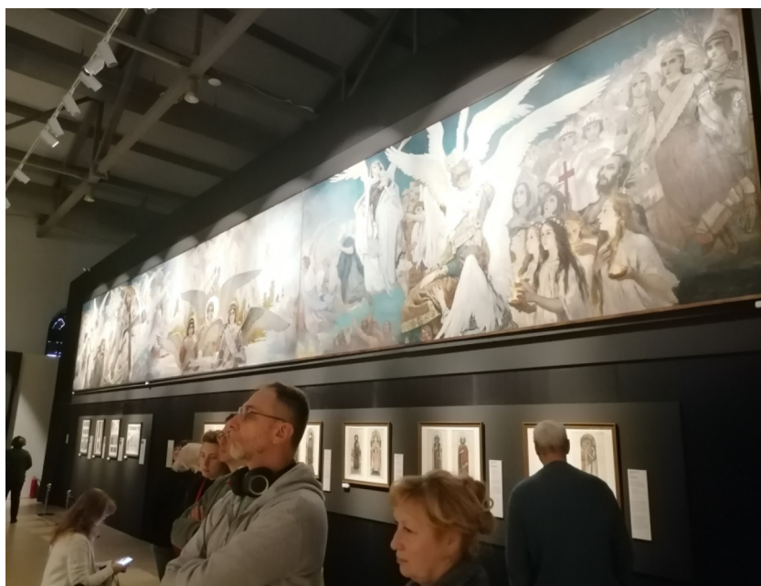
Рис. 5. Центральный зал выставки. Fig. 5. The main exhibition hall.

христианские святые, почитаемые в лике мучениц, перед ними – Мария Магдалина с алавастровым сосудом мирра в руках, рядом с ней – Мария Египетская. Над раскаявшимся разбойником, несущим свой крест, мы видим праотца Адама, Еву и Авеля. В правой части триптиха ангелы несут великомученицу Варвару с мечом на груди и Екатерину; их окружают пять мудрых дев со светильниками, а за ними – три отрока в ассирийских одеждах: Анания, Азария и Михаил, живыми вышедшие из огненной печи.