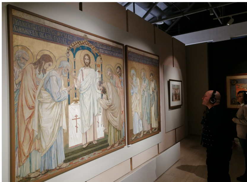
Рис. 11. Васнецов В.М. Евхаристия. Оригинал для мозаики Собора Св. Александра Невского в Варшаве. Fig. 11. Vasnetsov, V. M. The Eucharist. Original design for the mosaic at St. Alexander Nevsky Cathedral in Warsaw.

синий и фиолетовые оттенки контрастируют с золотом фона, лица Иисуса Христа и апостолов молчаливы и задумчивы, авторский стиль художника в тщательном внимании к подобранным деталям и особенно выразительным глазам изображенных. Совершенно иначе смотрятся расположенные на противоположной стене эскизы для Георгиевского собора в Гусь-Хрустальном (1896–1904), для которых характерна незавершенность и легкость. Завершает зал оригинал для плащаницы, шитой шелками, для церкви Спаса Нерукотворного в селе Абрамцево (1901 г.), выполненный графитным карандашом, темперой с добавлением бронзовой и серебряной красок на бумаге, наклеенной на холст. Лаконичность, графичность и цветовые контрасты выделяют эту работу, однако образы двух серафимов в виде голов с крылами, парящих над телом Христа, вновь смотрятся несколько странновато.