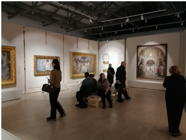
Рис. 2. Первый выставочный зал.

одежд собравшихся, позади самого князя, находящегося вниз в самом центре, стоят витязи из его дружины в шлемах и кольчугах.