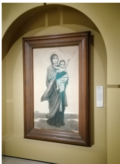
Рис. 9. Васнецов В.М. Богоматерь с младенцем. 1894.

Fig. 8. Vasnetsov, V. M. The Seraphim, 1885–1886.