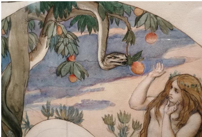
Рис. 4. Васнецов В.М. Грехопадение. Ева и змий. Фрагмент. 1891.

гг.: если в изображениях, посвященных образам исторических деятелей Древней Руси, В.М. Васнецов использовал традиции народного искусства, то в сюжетах о жизни первых людей в раю ощущаются тенденции, восходящие к прерафаэлитам [12, с. 72].