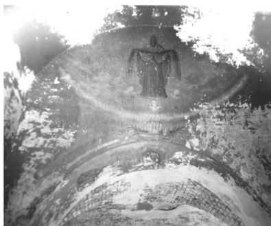
Фотографии 1992 г.